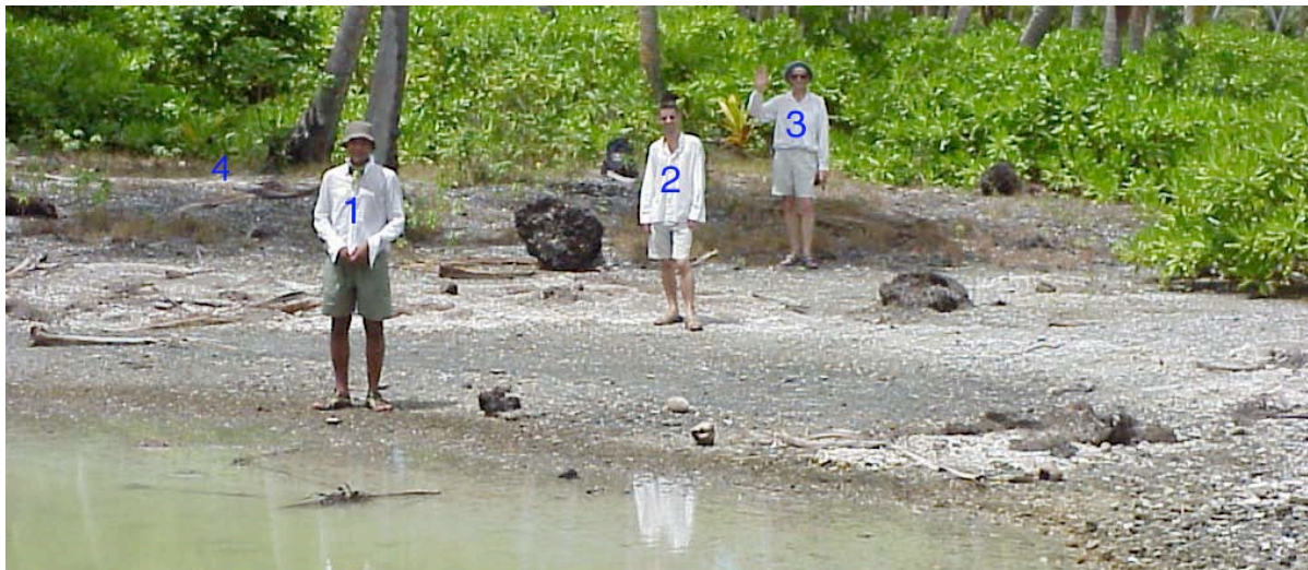
Ufer des Queen´s Bath (Hithadhoo Island, Addu Atoll). Die 4 markiert das Uferniveau im Jahr 400 vor Christus (+ 60 cm), die 3 den Hochwasserstand von 1790 bis 1970 (+ 20 – 30 cm), die 2 den heutigen Hochwasserstand und die 1 den heutigen Normalpegel.

Nils-Axel Mörner: Ja, sowohl die Messdaten von den Malediven, Tuvalu und Vanuatu als auch von Bangladesch und Indien lassen daran keinen Zweifel. Würde der globale Meeresspiegel steigen, müsste die Rotationsgeschwindigkeit der Erde abnehmen. Das ist nicht der Fall. Im Gegenteil: Sie beschleunigt sich.