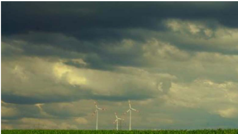
Bild 1: Die friedliche Idylle täuscht. Windräder töten Vögel und Fledermäuse, gefährden Spaziergänger und machen krank. Sie ruinieren unsere Kulturlandschaft, entwerten Grund und Boden, verteuern den Strom und bringen friedliche Bürger gegeneinander auf. Sie sind Symbole des Versagens der Naturschutzverbände und der Politik.

Aus der Ferne gesehen drehen sie sich langsam und friedlich. Und die sollen Vögel und Fledermäuse töten, Storchen- und Kranichhäckler sein, wie Vogelfreunde behaupten, Eisbomben verschießen und Symbole des Versagens der Naturschutzverbände sein?