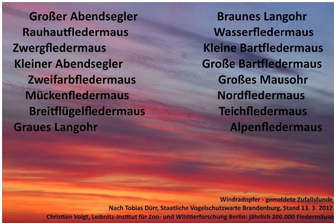
Bild 7: Fast alle Arten von Fledermäusen werden Opfer von Windrädern, darunter viele ziehende Fledermäuse aus Ost-Europa