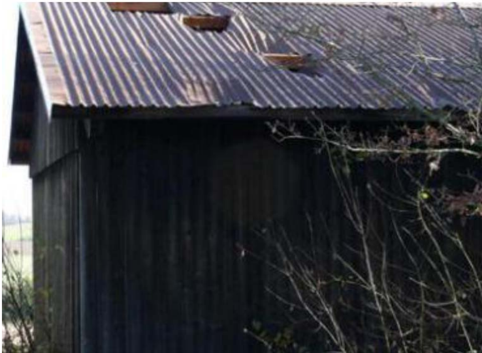
Bild 10: Eisgeschosse von einem 130 Meter entfernten Windrad haben drei Löcher in das Blechdach geschlagen. Ein Schädeldach wurde zum Glück nicht getroffen

Weil der Unterdruck an den Rotorblättern noch eine weitere Folge hat. Im Großen kennen wir den Effekt von den Tiefdruckgebieten. Das Wetter trübt sich ein, Wolken ziehen auf, es regnet oder schneit, denn bei fallendem Luftdruck kondensiert das Wasser, das in der Luft unsichtbar gelöst ist, zu Tröpfchen. Die sehen wir als Nebel oder Wolken. Vergleichbares löst der Unterdruck an den Rotoren aus. Die Wassertröpfchen aber können gefrieren und sich an den Rotorblättern als Eiskrusten festsetzen. Das Risiko besteht das ganze Jahr über, besonders aber bei Nebel oder trübem Wetter um null Grad, aber auch bei Temperaturen über Null. Nach und nach werden die Eiskrusten dicker und schwerer. Zugleich zerren Fliehkräfte an ihnen und irgendwann lösen sie sich und schießen als Eisplatten wie Geschosse mit bis zu 400 km/h davon. Ihre Reichweite hängt von der jeweiligen Stellung des Rotorblattes und seiner Radialgeschwindigkeit zum Zeitpunkt der Ablösung ab. Deshalb können die Eisgeschosse unmittelbar am Turm einschlagen. Sie können aber auch an jedem anderen Punkt in einem Umkreis von einigen hundert Metern um das Windrad herum einschlagen, wobei der Wind sie zusätzlich ablenkt. Der TÜV Nord kommt in einer Untersuchung auf 600 m Reichweite. Und so können die Folgen aussehen: