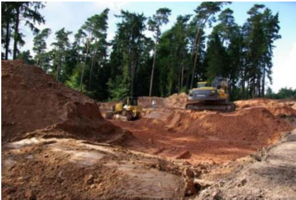
Bild 12: Für jedes Windrad werden 10.000 m 2 Wald zerstört und das Umfeld dauerhaft biologisch entwertet

Auch der Schutz unserer Kulturlandschaft gehört zum Markenkern des Naturschutzes und steht in den Satzungen ihrer Verbände. Windräder und neue Stromtrassen verkehren auch dieses Ziel in sein Gegenteil. Der Kölner Dom ist einzigartig und 157 m hoch. Windräder sind 200 m hoch und höher. 22.600 dieser Industriegiganten stehen bereits und es werden immer mehr. Sie degradieren unsere Kulturlandschaft zum Industriegebiet. Trotzdem fordern Spitzenfunktionäre der Umweltschutzverbände den weiteren Ausbau. Jetzt geben sie auch noch die Wälder für Windräder frei, sogar in Landschaftsschutzgebieten, in Naturparks und nahe an Naturschutzgebieten sollen Windräder hin. Gegen Geld verzichten sie auf ihr