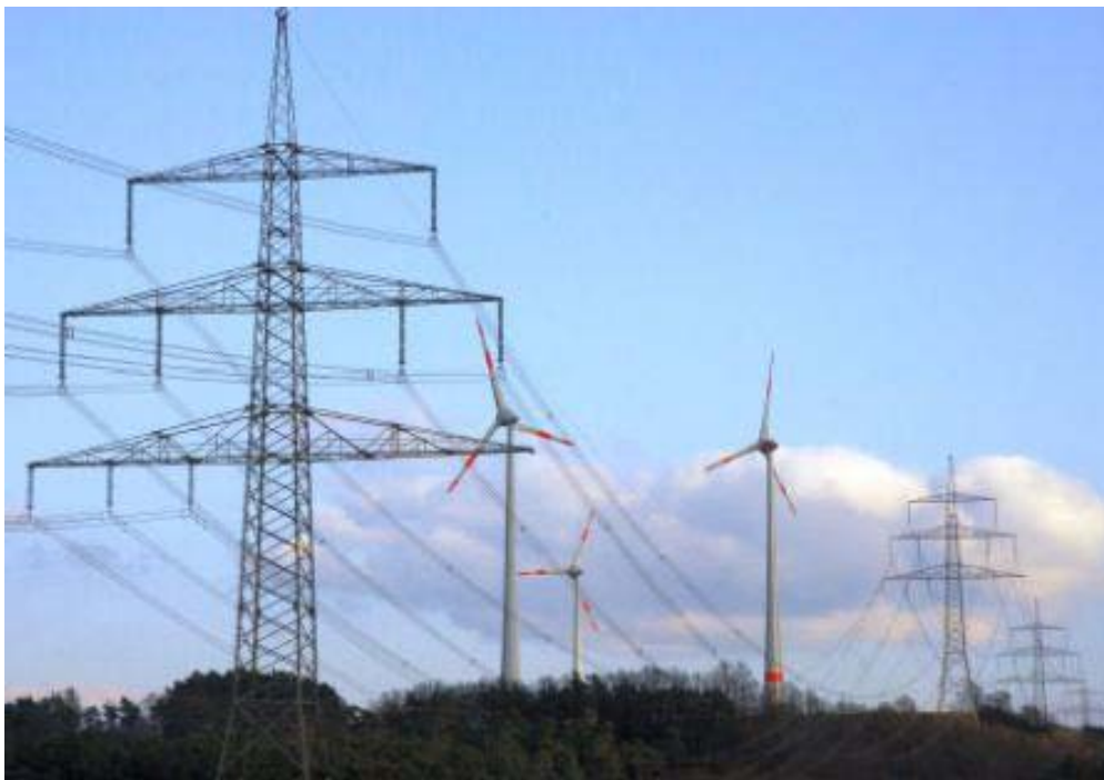
Bild 9. Mit neuer Technik sollen 380 KV-Leitungen doppelt so viel Strom transportieren und sich dabei auf bis zu 210 °C erhitzen. Das wären dann elektrische Heizdrähte quer durch Deutschland. Und was ist mit den Vögeln, die sich auf die heißen Drähte setzen?

Das Stromnetz in Deutschland ist nicht für den Transport von Wind- und Solarstrom ausgelegt. Deshalb müssen viele Tausend Kilometer neue Fernleitungen gebaut werden. Doch gegen die gibt es massiven Widerstand und der Bau würde viele Jahre dauern. Aber man könnte die vorhandenen Fernleitungen so umbauen, dass sie doppelt so viel Strom leiten können. Das geht mit den derzeitigen Leiterseilen („Stromdrähten“) deshalb nicht, weil sie sich erwärmen und ausdehnen. Sie hängen durch und zwar umso tiefer, je mehr Strom durch geleitet wird und spätestens bei 80 °C ist Schluss.