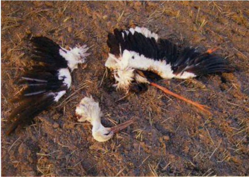
Bild 3: Echte "Schlagopfer" weisen häufig schwere Frakturen oder gar eine Zerteilung des Rumpfes auf, wie hier bei einem Weißstorch, dessen Einzelteile am Fundort zusammengesucht wurden.