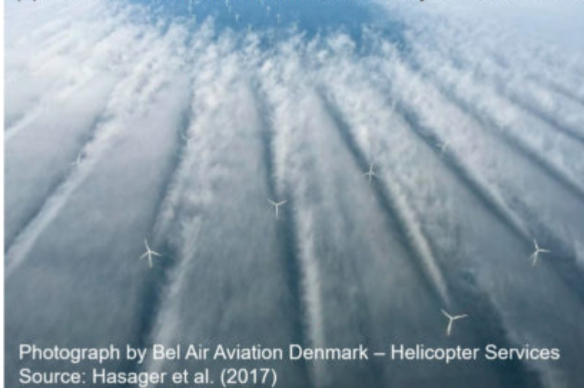
(b) Horns Rev 2 offshore wind farm, 25 January 2016, 12:45 UTC

Photograph by Bel Air Aviation Denmark – Helicopter Services Source: Hasager et al. (2017)