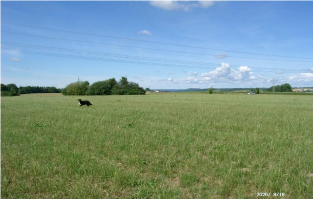
Bild 8. Der letzte verbliebene Tümpel auf einer Hochfläche (hinter dem Hund). Im Mittelalter war die Fläche übersät mit Tümpeln. Die schwäbische Bezeichnung woagarai, falsch übersetzt mit Wagenrain drückt dies aus. Woaga , gesprochen wie schwoab, heißt Tümpel, im Fränkischen wooga. Am 18.08.2020 waren bereits 76% der Augustniederschläge gefallen.

2. Das Wasser wird auf den landwirtschaftlichen Flächen in Tümpeln, Erdvertiefungen und Versickerungslöchern zurückgehalten. Versickerung ist notwendig, um die Grundwasservorräte aufzufüllen, aber auch die Verdunstung trägt zur Landschaftsabkühlung bei Hochsommerwetter positiv bei. Regenrückhaltung ist das Gegenteil von schnellem Ableiten, das in den letzten 60 Jahren praktiziert wurde.