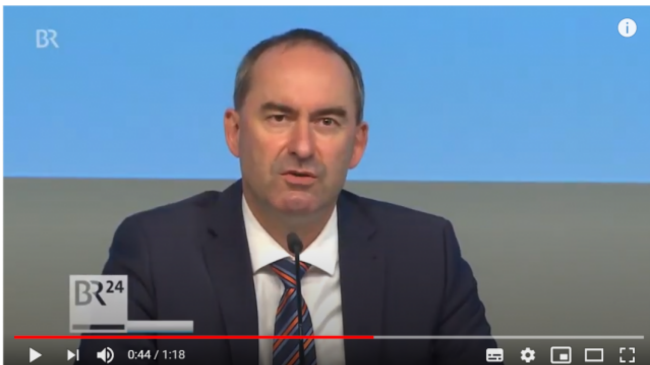
Bild 2 BR24 Video vom 29.05.2020, Vorstellung der Bayerischen Wasserstoffstrategie. YouTube Link

H. Aiwaner ab 00:44: Russland würde uns Wasserstoff in beliebigen Mengen zu günstigen Preisen liefern können. Wir denken an Nordafrika. Es kann Marokko sein. Und es sind große, internationale Herkünfte von Australien bis Chile in der Debatte.