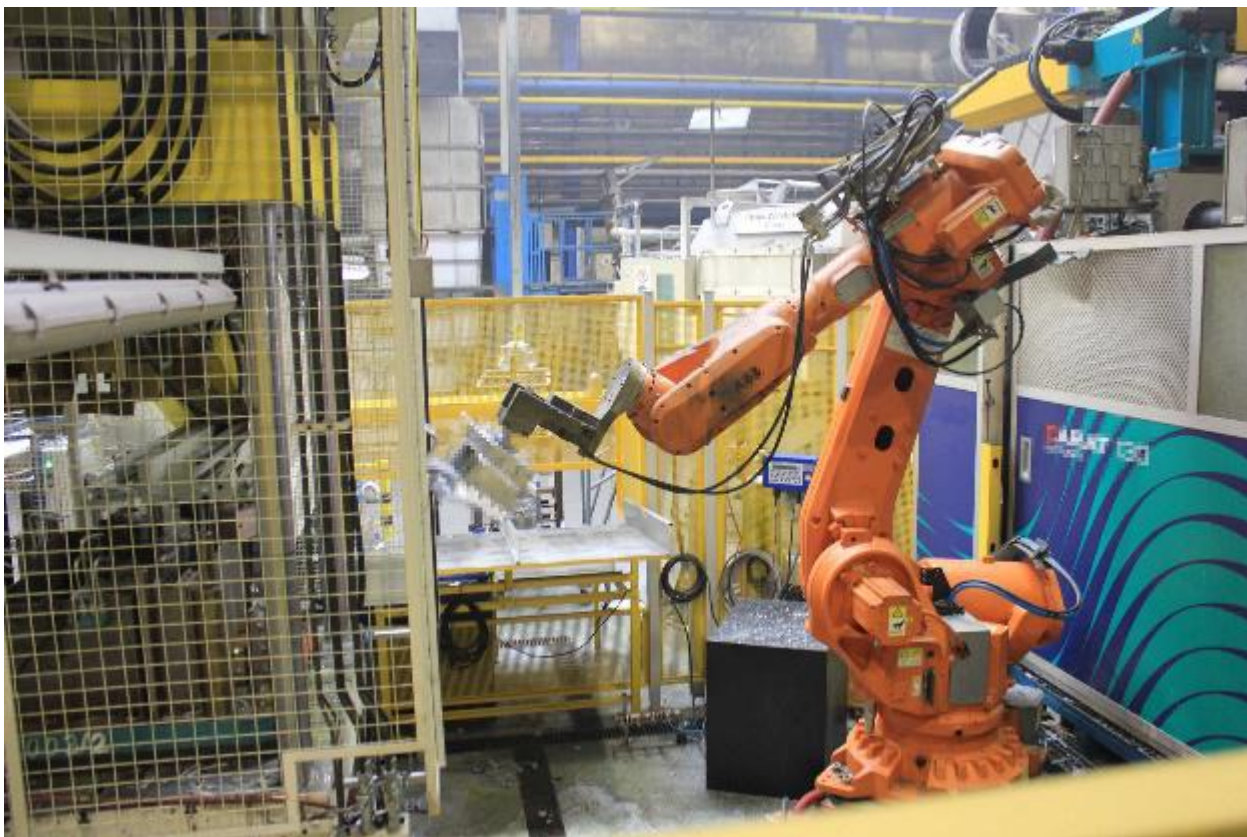
Bild 2. Viel Maschine, wenig Mensch: In modernen Industriebetrieben wurden schwere und gefährliche Arbeiten längst von Robotern übernommen

Die modernen Wissenschaften in Bereichen wie Ingenieurwesen, Physik, Medizin, Biologie, Chemie und Pharmakologie ermöglichen heute eine zuverlässige, gesunde, reichhaltige und auch wohlschmeckende Vollversorgung der gesamten Bevölkerung mit Nahrung und medizinischer Versorgung. Dieser hohe Lebensstandard ermöglicht es uns, überall auf der Welt die jeweils dort erzeugten Nahrungs- und Genussmittel von Getreide und Feldfrüchten über Fleisch, Obst und Gemüse einzukaufen. Wer es sich leisten kann, kann selbst exotischste Produkte schnell und frisch aus aller Herren Länder beziehen. Und wer meint, es „gesünder“ haben zu müssen, kann auf sogenannte Bioprodukte, Veganismus oder – im Gesundheitsbereich – auf alternative Ansätze wie Homöopathie oder Akupunktur zurückgreifen.