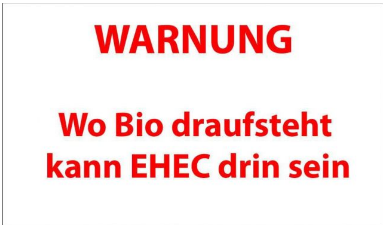
Bild 5. Auch bei sogenannten Bio-Produkten sind Risiken und Nebenwirkungen nie ausgeschlossen. Allerdings ist dort kein Beipackzettel vorgeschrieben (Grafik: Autor)

Mit anderen Worten: Herr Lietsch ist ein klassischer Vertreter jener „bunten, alternativen“ Schattenökonomie, die sich neben der und gegen die etablierte Industriegesellschaft etabliert hat und vor allem „Wohlfühlbotschaften“ samt dazugehöriger Produkte und Dienstleistungen für Besserverdienende vermarktet. Dass man dabei von den Reichtümern zehrt, welche die verachtete Industrie mitsamt der normalen Landwirtschaft seit jeher für das ganze Land erzeugt, wird in der Gedankenwelt solcher Menschen bequemerweise ausgeblendet.