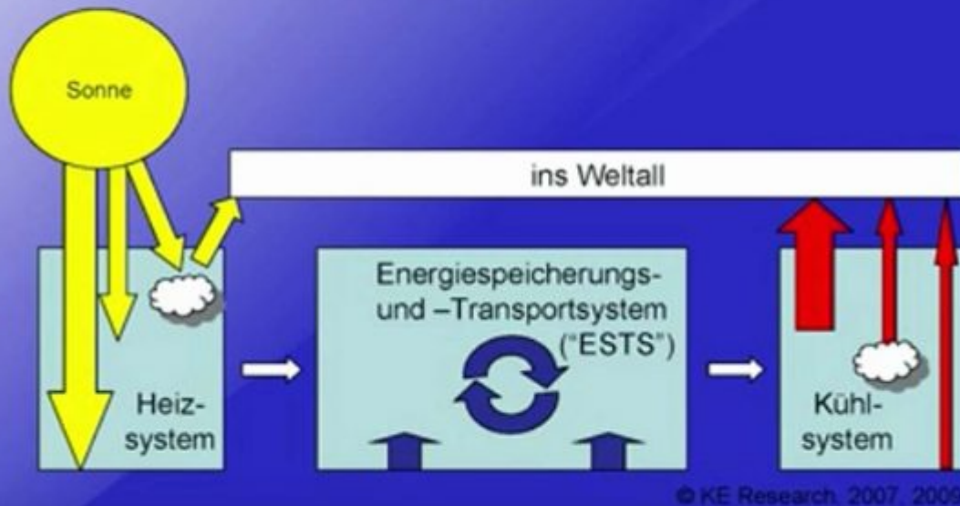
Abbildung 1: Chart aus dem Vortrag von Klaus Ermecke „ Energiepolitik im Konzeptnebel? “

Diese Abbildung von Ermecke hat gegenüber den bekannten Darstellungen von Kiehl und Trenberth zwei Vorteile und einen großen Nachteil: Einerseits beschränkt sie sich auf eine grundsätzliche Betrachtung der beiden wesentlichen Strahlungsvorgänge (IN und OUT) und beinhaltet insbesondere auch die Wärmespeicherung, andererseits fehlt hier eine Quantifizierung der Strahlungsflüsse. Diesen fehlenden Strahlungsflüssen ist nun mit meiner hemisphärischen Energiebilanz [1] sehr leicht abzuhelfen. Dort wird die temperaturwirksame hemisphärische Sonneneinstrahlung mit der durchschnittlichen globalen Abstrahlung gleichgesetzt. Und der Wärmeinhalt der globalen Zirkulationen (Atmosphäre und Ozeane) wird über die gemessene Durchschnittstemperatur unserer Erde (NST) definiert: Die NST wird üblicherweise mit 14,8 Grad Celsius angegeben. Sie stellt eine langjährige globale Durchschnittstemperatur dar, bei der im Idealfall alle Energieflüsse (IN und OUT) über den Tag- und Nachtverlauf sowie die Breitenverteilung und der Jahresverlauf aller benutzten Meßstationen bereits korrekt herausgemittelt worden sein sollten.