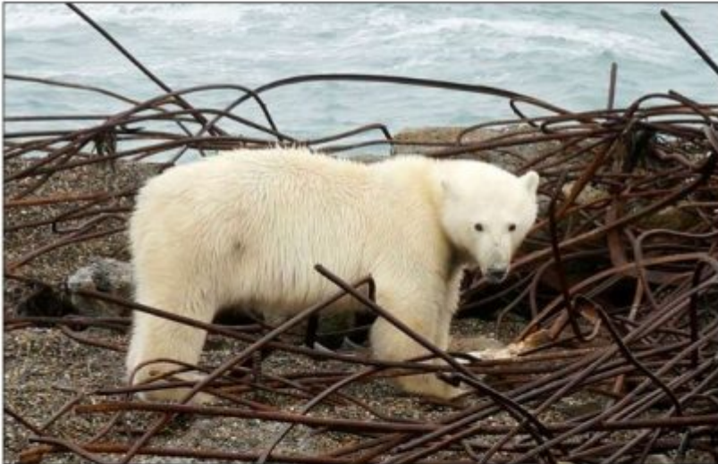
"Jetzt sind die Walrosse verschwunden, aber ungefähr 20 Eisbären sind praktisch neben dem Dorf geblieben."

Rund 20 Bestien haben Ryrkayply umzingelt, und ein Bärenjunges versucht, durch das Fenster in ein Haus zu gelangen.