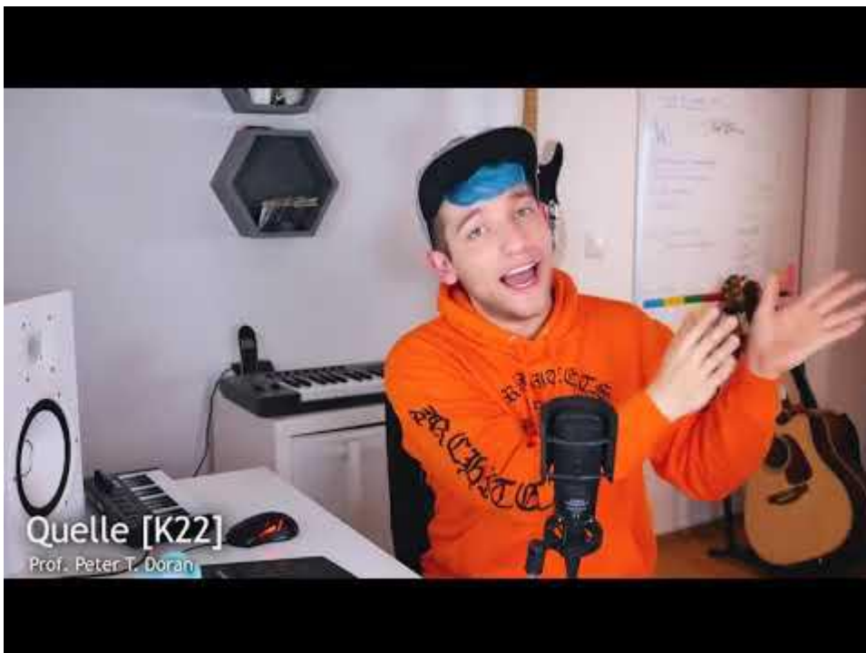
Bild 1 Eingebettetes Video von Rezo: „Die Zerstörung der CDU“. Vorsichtshalber der Link zu YouTube dazu:

Und genau so hat es der YouTuber „Rezo“ mit und in seinem Video gemacht: Rezo Video „Die Zerstörung der CDU“