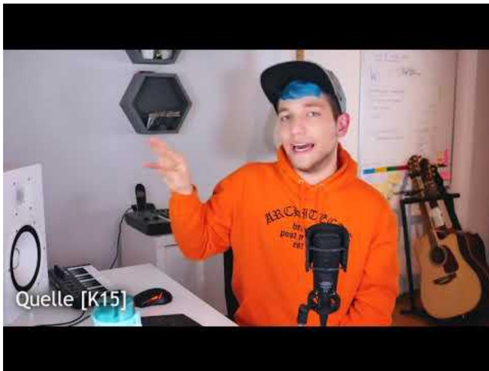
Bild 2 Eingebettetes Video der Rezension.

Gut gemacht und wirklich informativ eine filmische Rezension zum „Rezo“-Video: „Grünpopulismus mit Rezo“