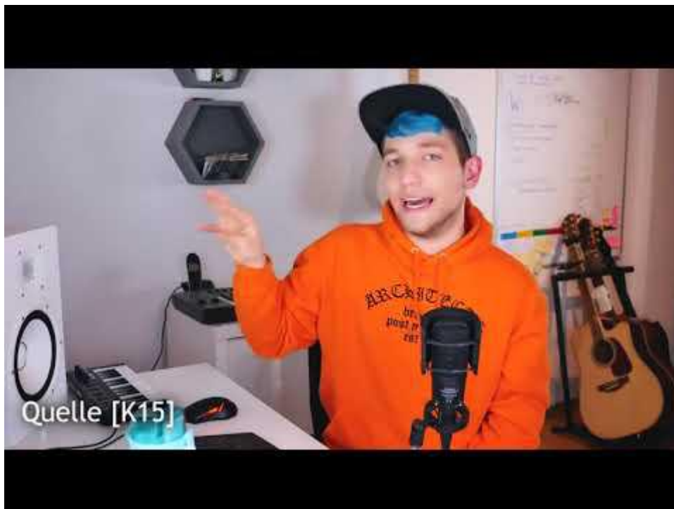
Bild 2 Eingebettetes Video der Rezension. Vorsichtshalber der direkte Link: YouTube

Gut gemacht und wirklich informativ eine filmische Rezension zum „Rezo“-Video: „Grünpopulismus mit Rezo“