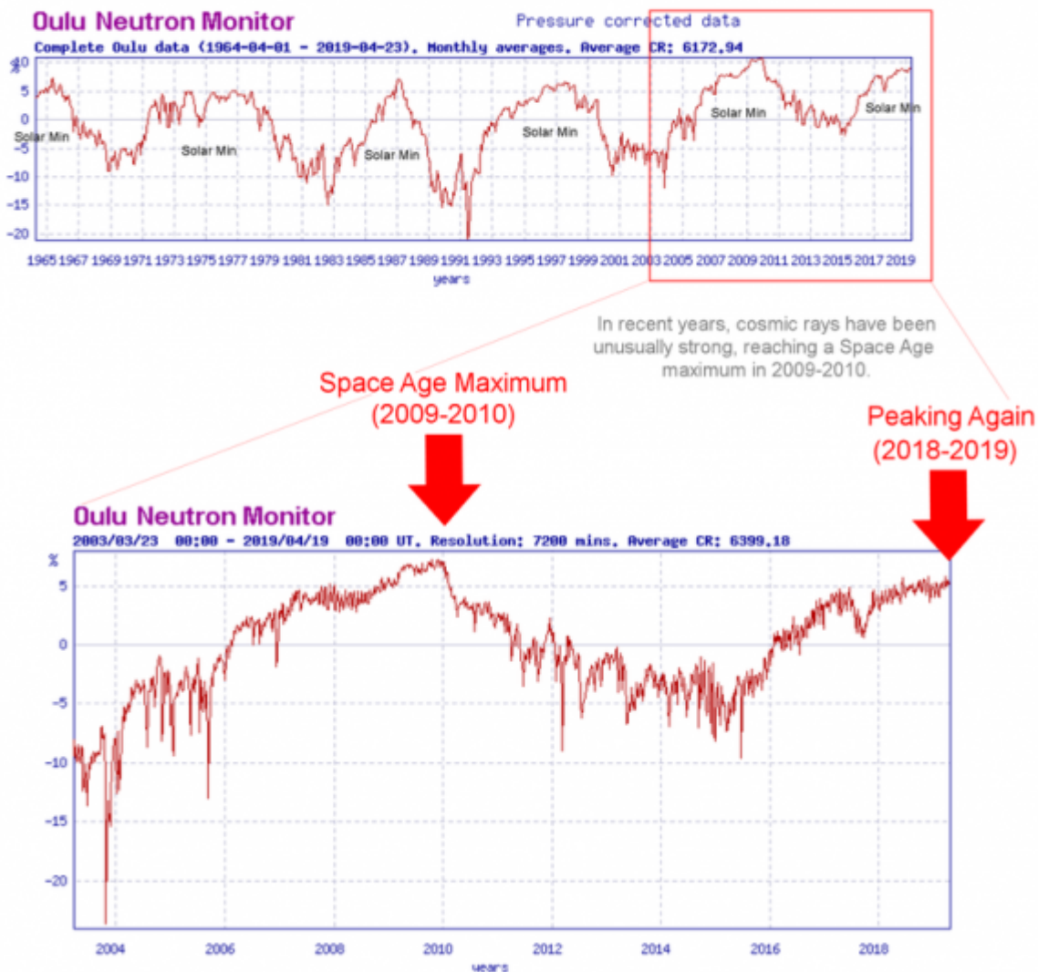
Abbildung 3.

Konsequenzen der Verstärkung kosmischer Strahlung: Wolkenbedeckung/Klima