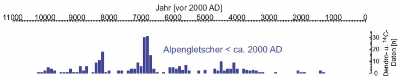
Abbildung 2: Blaue Balken markieren Zeiten, als viele alpine Gletscher kürzer als heute waren. Dargestellt sind Belege auf Basis von Baumringen und C14-Datierungen. Graphik verändert nach APCC 2014 .

Die Gletscher waren im Alpenraum während der letzten rund 11 000 Jahre [Holozän] gekennzeichnet durch lang andauernde Perioden mit vergleichsweise geringer Ausdehnung im frühen und mittleren Holozän (bis vor rund 4 000 Jahren) und mehrfache sowie weitreichende Vorstöße in den folgenden Jahrtausenden, die in den großen Gletscherständen der „Kleinen Eiszeit“ (ca. 1260 bis 1860 n. Chr.) kulminierten. Die gegenwärtigen Gletscherausdehnungen wurden im Früh- und Mittelholozän mehrfach sowohl unter- als auch überschritten.