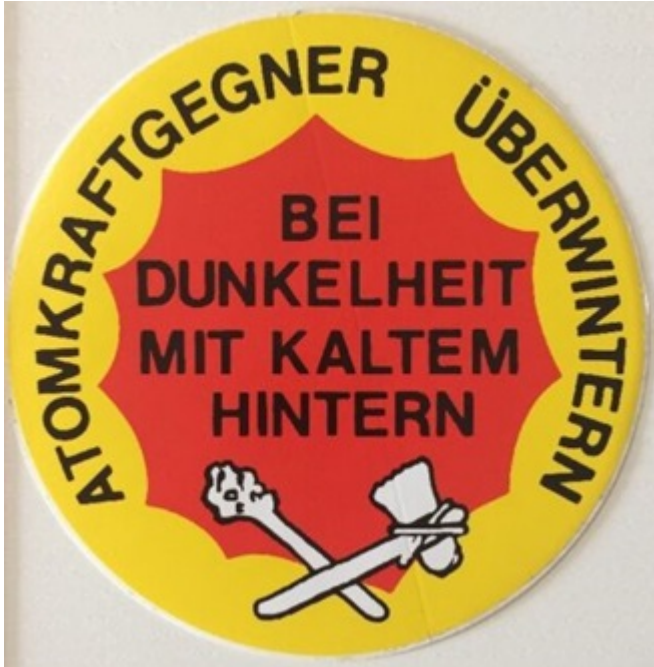
Abb.4: Zur verheulenden Kernenergie hat sich mittlerweile die Energie aus fossilen Energieträgern gesellt. Die Steinzeit rückt somit immer näher.

Dass solche „Lückenbüßer“ – laut deutschen Energiegesetz muss der Strom von den sog. Erneuerbaren vorrangig von den Netzbetreibern abgenommen werden – niemals wirtschaftlich zu betreiben sind, ist jedem, der sich halbwegs mit Betriebswirtschaft beschäftigt, sofort klar.