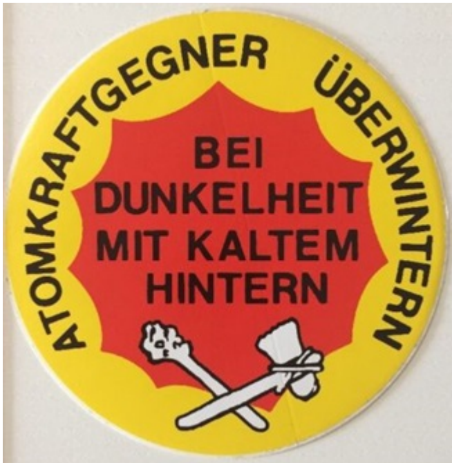
Abb.4: Zur verheulenden Kernenergie hat sich mittlerweile die Energie aus fossilen Energieträgern gesellt. Die Steinzeit rückt somit immer näher.

Dass solche „Lückenbüßer“ – laut deutschen Energiegesetz muss der Strom von den sog. Erneuerbaren vorrangig von den Netzbetreibern abgenommen werden – niemals wirtschaftlich zu betreiben sind, ist jedem, der sich halbwegs mit Betriebswirtschaft beschäftigt, sofort klar.