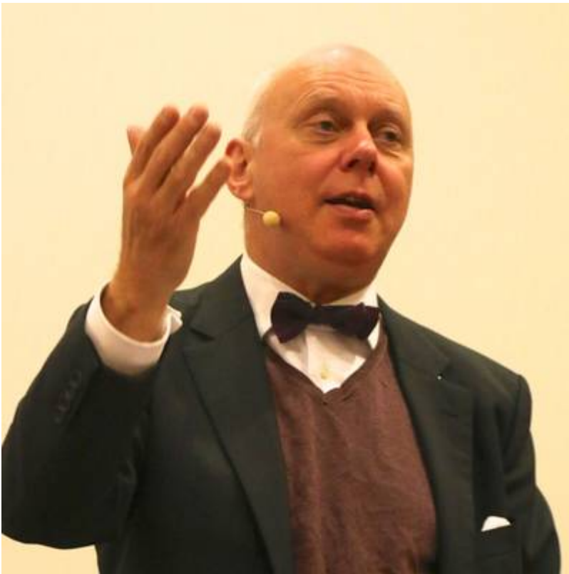
Bild 3. Prof. Dr. Kerber bei seinem Vortrag anlässlich der 10. IKEK zu Fragen des Einflusses grüner Politik auf die EU Klima- und Energiepolitik *

von Obama besonders aktiv in „Klimaschutzfragen“ und war bisher äußerst repressiv in Bezug auf die Verwendung fossiler Energieträger.