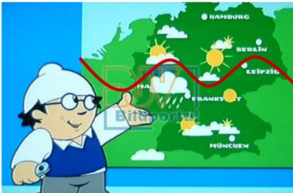
Abb. 4: Die Mainzelmännchen wissen, dass sich der PolarFrontJet direkt über Deutschland befindet und kennen dessen Auswirkungen durch die Abgrenzung der polaren Luftmassen von den subtropischen und den dadurch entstehenden turbulenten Wetterereignissen an deren Grenzschichten.

Frau Horneffer hätte sich diese Nachhilfestunde in Meteorologie und Bodenkunde ersparen können, hätte sie vor Ort, bei den Mainzelmännchen nachgeschaut. Die schlaunen Mainzelmännchen haben, wie der DWD, erkannt, was unser Wettergeschehen bestimmt (Abb. 4).