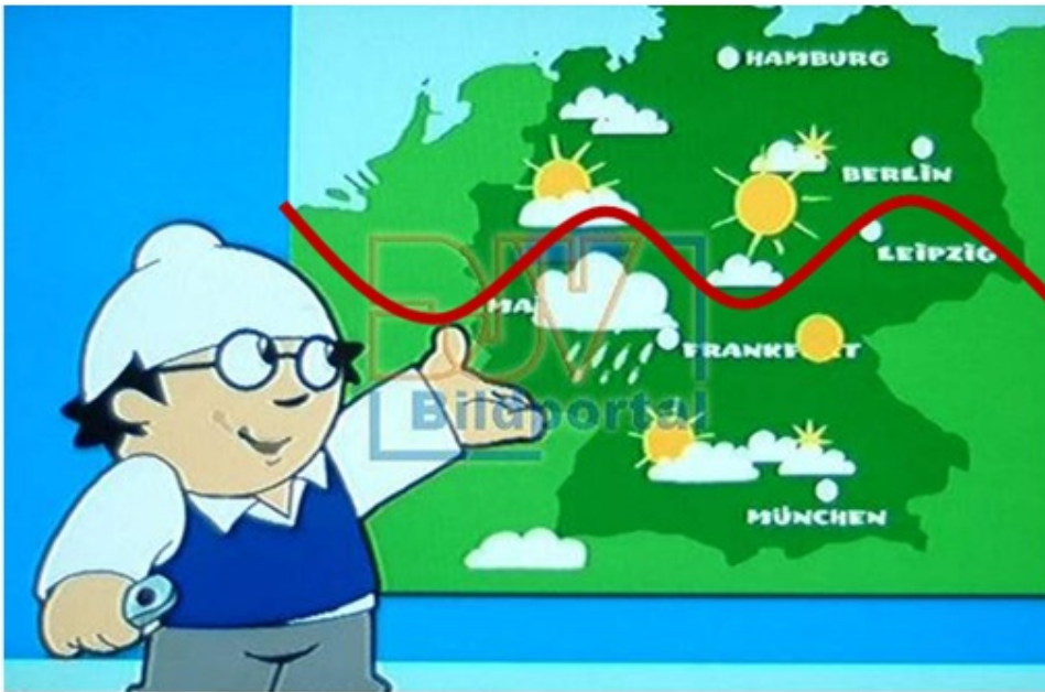
Abb. 4: Die Mainzelmännchen wissen, dass sich der PolarFrontJet direkt über Deutschland befindet und kennen dessen Auswirkungen durch die Abgrenzung der polaren Luftmassen von den subtropischen und den dadurch entstehenden turbulenten Wetterereignissen an deren Grenzschichten.

Aber die intelligenten Mainzelmännchen haben für Personen, die solch dummes Zeug von sich geben, wie Frau Horneffer, auch die richtige Antwort parat: Abb.