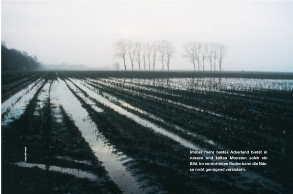
Abb.2, Quelle S.d.W.: Bei Starkregen oder länger anhaltenden Regenfällen kann das Wasser in den verdichteten Böden nicht mehr versickern. Weiteres Regenwasser muss deshalb abfließen und sammelt sich der Schwerkraft folgend in Tälern und Senken. Wir kennen solche Ereignisse sonst eher aus Trockengebieten wie Namibia.

Auf Seite 76 ist in S.d.W. 08/2006 folgende Abbildung zu sehen, die die wissenschaftlichen Erkenntnisse der Forscher visualisiert.