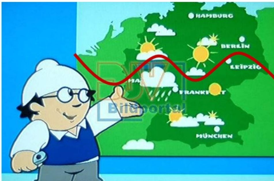
Abb. 4: Die Mainzelmännchen wissen, dass sich der PolarFrontJet direkt über Deutschland befindet und kennen dessen Auswirkungen durch die Abgrenzung der polaren Luftmassen von den subtropischen und den dadurch entstehenden turbulenten Wetterereignissen an deren Grenzschichten.

Frau Horneffer hätte sich diese Nachhilfestunde in Meteorologie und Bodenkunde ersparen können, hätte sie vor Ort, bei den Mainzelmännchen nachgeschaut. Die schlaunen Mainzelmännchen haben, wie der DWD, erkannt, was unser Wettergeschehen bestimmt (Abb. 4).