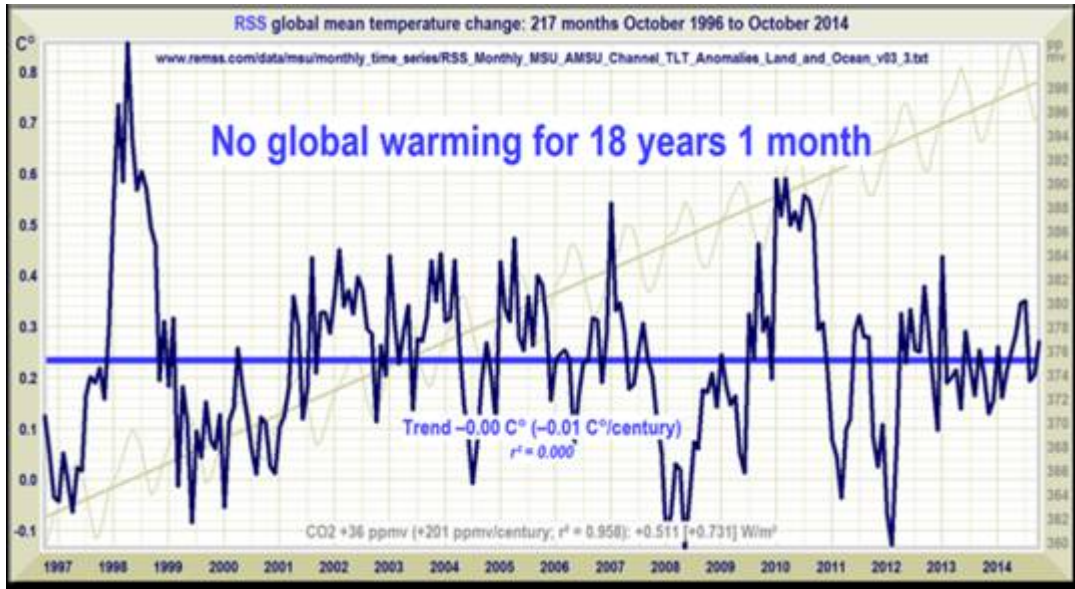
Abbildung 1: Globale Mitteltemperatur von 1997 bis September 2014; bestimmt mittels Satellitenprojekt RSS, sowie Trendentwicklung derselben. Seit über 18 Jahren kein Anstieg. Dahinter (graue Kurve) der Anstieg der CO2 Konzentration. Zur Erinnerung. Das IPCC wurde 1988 bereits 10 bis 12 Jahre nach dem Minianstieg der 80er Jahre gegründet.

Komm' mir nicht mit Fakten, meine Meinung steht“ heißt ein altes Sprichwort bei den pragmatischen Engländern.