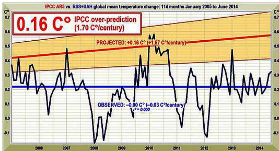
Abbildung 3: Vorhergesagte Temperaturänderung, Januar 2005 bis Juni 2014 mit einer Rate äquivalent zu 1,7°C (1,0; 2,3°C) pro Jahrhundert (orange Fläche mit dicker roter Best Estimate-Trendlinie), verglichen mit den beobachteten Anomalien (dunkelblau) und dem Trend (hellblau).

Im Jahre 1990 lag die zentrale Schätzung hinsichtlich einer kurzfristigen Erwärmung um zwei Drittel höher als heute. Damals war es ein Äquivalent von 2,8°C pro Jahrhundert. Jetzt ist es ein Äquivalent von 1,7°C – und, wie Abbildung 3 zeigt, ist selbst das noch eine substantielle Übertreibung.