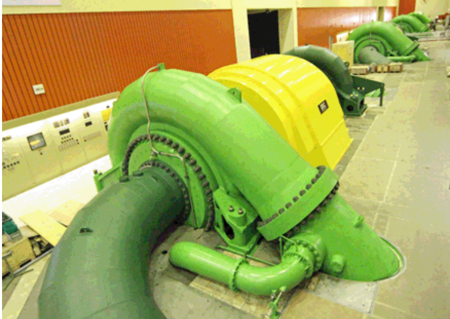
Bild 3. Eine Pumpen- Turbiniengruppe in einem Schweizer Pumpspeicherkraftwe rk