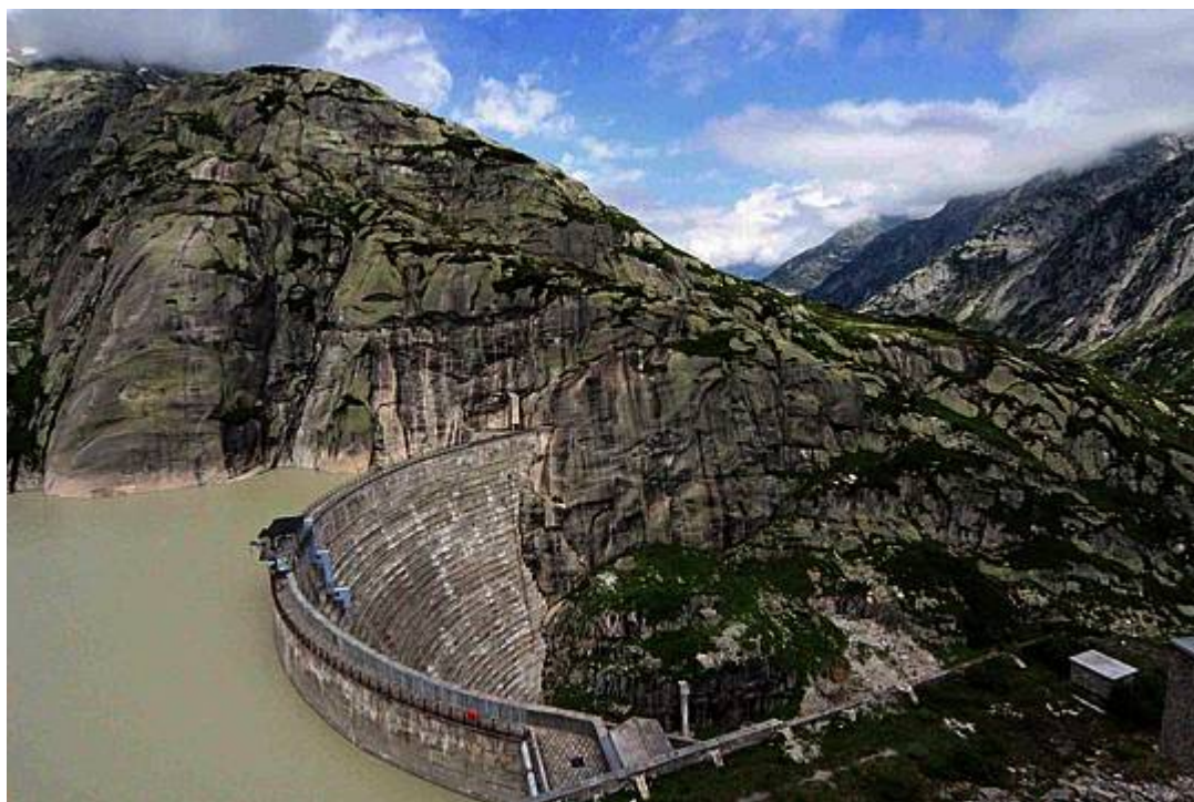
Bild 2. Bereits vor Generationen haben vorausschauende Schweizer Unternehmen viel Wagemut und Kapital in den Ausbau von Wasserkraftwerken – hier das Grimsel-Kraftwerk der KW0 – investiert