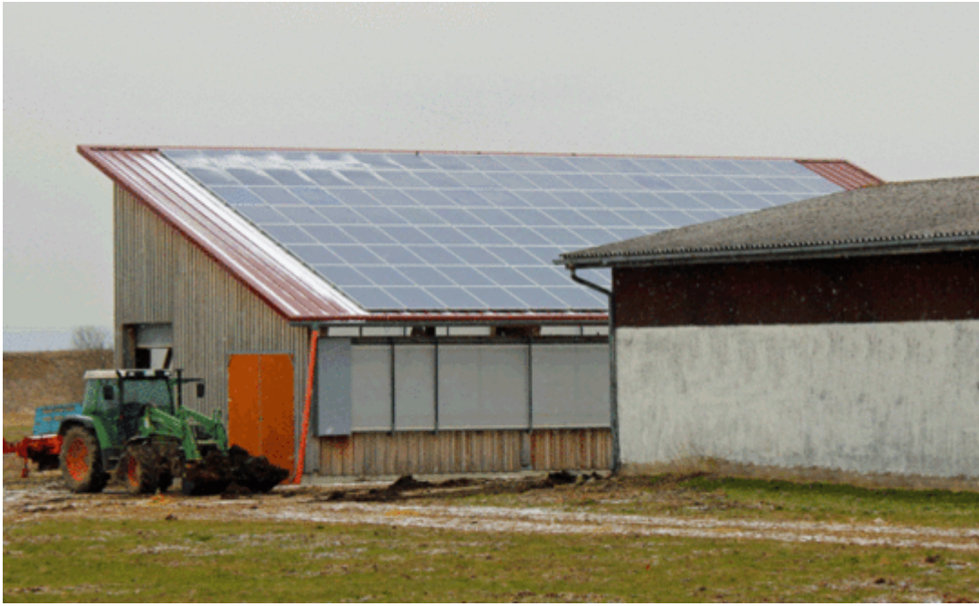
Bild 4. Mit Wind- und