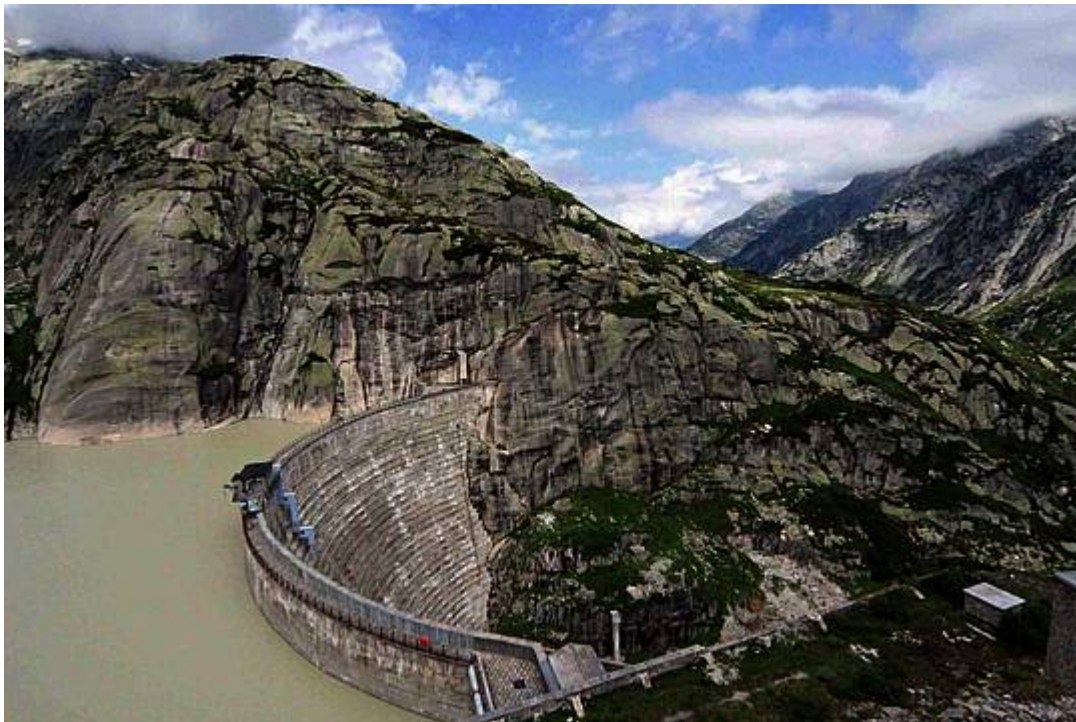
Bild 2. Bereits vor Generationen haben vorausschauende Schweizer Unternehmen viel Wagemut und Kapital in den Ausbau von Wasserkraftwerken – hier das Grimsel-Kraftwerk der KW0 – investiert