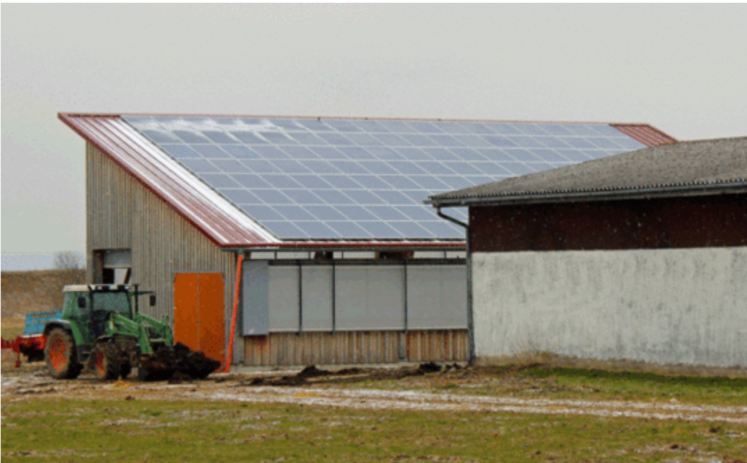
Bild 4. Mit Wind- und Solaranlage