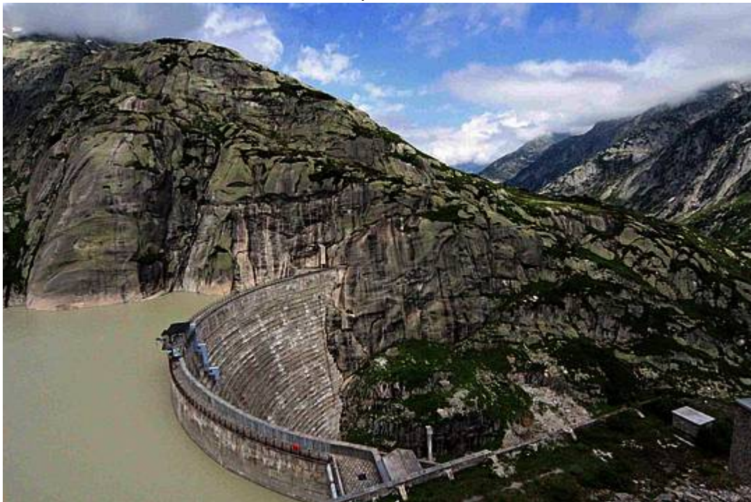
Bild 2. Bereits vor Generationen haben vorausschauende Schweizer Unternehmen viel Wagemut und Kapital in den Ausbau von Wasserkraftwerken – hier das Grimsel-Kraftwerk der KWO – investiert

nächsten drei bis fünf, wenn nicht gar zehn Jahren keine Änderung des Ist-Zustandes zu sehen sei. Er frage sich, wie es so weit habe kommen können, dass die Wasserkraft plötzlich nicht mehr rentabel sei.