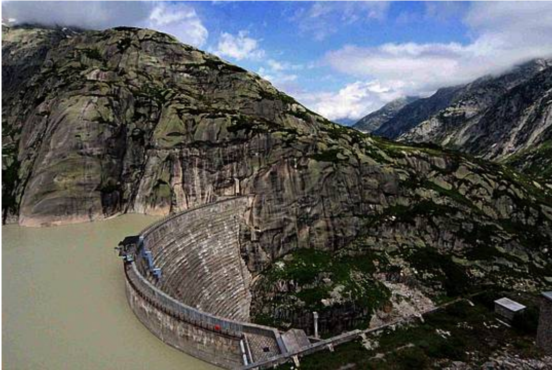
Bild 2. Bereits vor Generationen haben vorausschauende Schweizer Unternehmen viel Wagemut und Kapital in den Ausbau von Wasserkraftwerken – hier das Grimsel-Kraftwerk der KWO – investiert

keine Änderung des Ist-Zustandes zu sehen sei. Er frage sich, wie es so weit habe kommen können, dass die Wasserkraft plötzlich nicht mehr rentabel sei.