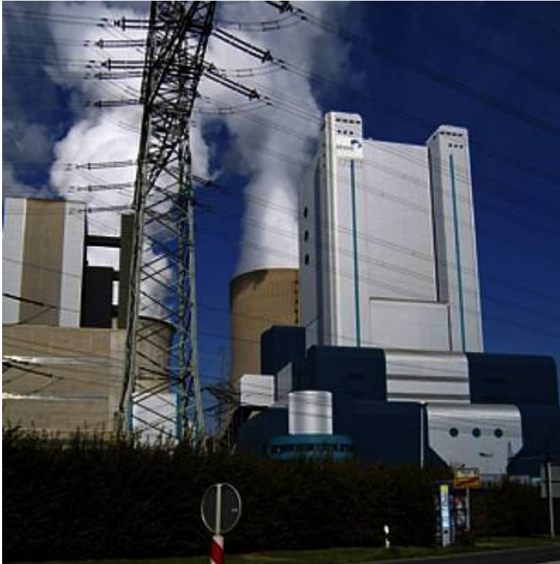
Bild 2: Konventionelle Kraftwerke haben eine doppelte Aufgabe. Einerseits liefern sie Strom, wenn Wind und Sonne dazu mal wieder keine Lust haben. Zudem übernehmen sie bei Störungen die Stabilisierung des Stromnetzes durch Bereitstellung von Regelenergie

ins Netz einzuspeisen. Doch die Errichter der neuen Anlage haben etwas ganz anders im Sinn. Trotz ihrer beeindruckenden Größe kann diese „Monsterbatterie“ in Wirklichkeit nur völlig unzureichende Energiemengen einlagern. Darauf wird auch schon im Artikel der „Welt“ hingewiesen. De facto reicht die ganze Kapazität der 6 Mio. € teuren Installation gerade einmal aus, um die Leistung aufzunehmen, die eine einzige 5-MW-Windturbine bei geeigneter Wetterlage innerhalb einer Stunde abgibt. Ihre wirkliche Aufgabe ist deshalb auch lediglich der Ausgleich der extrem kurzfristigen zusätzlichen Schwankungen, die für die Produktion von „EE-Strom“ typisch sind. Solche Spitzen treten beispielsweise auf, wenn eine plötzliche Bö alle Propeller gleichzeitig zum Schnurren bringt.