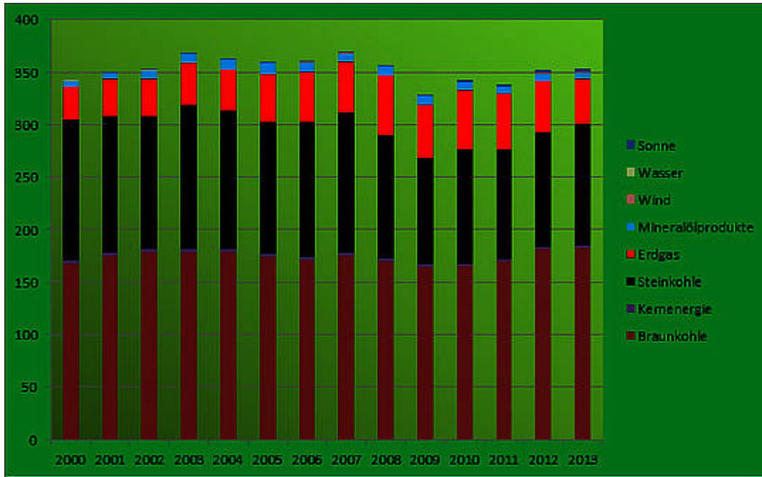
Bild 2: Trotz ständig weiter steigender Kosten ist keine Reduzierung der CO 2 -Emissionen bei der Stromproduktion festzustellen

Fazit: Der deutschen Politik fehlen sowohl der Wille als auch die Kraft, diese von ihr verbockte und inzwischen völlig aus dem Ruder gelaufene Entwicklung aufzuhalten oder gar zurückzudrehen. Stattdessen gibt man weiter immer der gerade am lautesten schreienden Lobbygruppe nach und meint, sich dadurch Zeit erkaufen zu können. Doch diese Methode des „sich-durchwurstelns“ kann angesichts der immer drängender werdenden Probleme auf Dauer nur ins Chaos führen. Der Strompreisanstieg wird weiter voranschreiten und die Industrie wird zunehmend Arbeitsplätze ins Ausland verlagern. Völlig richtig merkt SPON hierzu an: „Dieser Kostenschub ließe sich nur durch grundsätzlichere Reformen stoppen – eine Art Masterplan für der gesamten deutschen Kraftwerkspark, den Ausbau der Stromnetze und die Verlagerung des Verbrauchs in stromreiche Zeiten umfasst. Ein solcher Masterplan fehlt bislang, die wahren Kostentreiber geht Schwarz-Rot nicht an.“