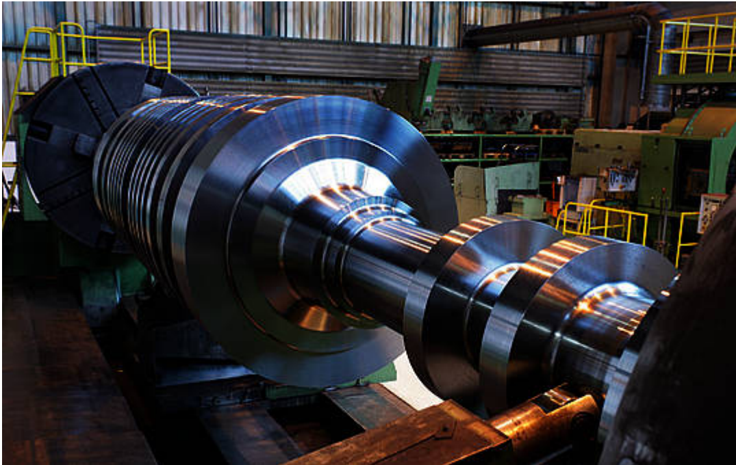
Bild 2. Solche Wellen für Kraftwerke wiegen oft mehr als 100 Tonnen und rotieren mit bis zu 3000 Umdrehungen pro Minute. Sie speichern daher große Energiemengen

Es ist die darin gespeicherte, sofort ohne jede Verzögerung verfügbare Energie, welche in den ersten Sekunden einer größeren Störung die Netzfrequenz und damit die Netzstabilität innerhalb der zulässigen Grenzen hält. Unmittelbar darauf reagieren die Dampfventile der für die Notversorgung herangezogenen Kraftwerke und sorgen beispielsweise dafür, dass mehr Dampf auf die Turbine geleitet wird. Damit wird die zweite Verteidigungslinie der Netzstabilisierung aktiviert, die großen Energiereserven, die in den vielen tausend Tonnen extrem hoch erhitzten und komprimierten Dampfs gespeichert sind, welchen die riesigen Dampfkessel fossiler Kraftwerke ständig vorrätig halten. Diese extrem schnelle und in Sekunden verfügbare Stabilisierung kann nur von dampfbetriebenen Fossil- und Kernkraftwerken mit massiven, schnell rotierenden Generatoren gewährleistet werden. Einen gewissen Beitrag können auch Wasserkraftwerke leisten. Solar- und Windenergie sind hierzu dagegen außerstande, denn sie halten weder nennenswerte Rotationsenergie vor noch lassen sich Sonne und Wind gezielt herauf- oder herunterregeln. Vor diesem Hintergrund lassen Behauptungen, eine 100 prozentige Stromversorgung aus erneuerbaren Energien ohne konventionelle Kraftwerke sei möglich, doch erhebliche Zweifel daran aufkommen, ob die Betreffenden überhaupt wissen, wovon sie reden.