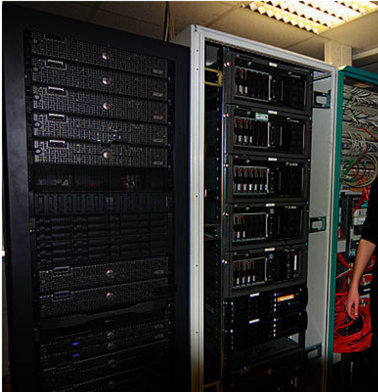
Bild 5. Stromausfälle legen die in jedem modernen Betrieb unentbehrlichen Computer lahm. Das kann zu erheblichen Ausfällen und sogar Anlagenschäden führen

Schon eine einzige Stunde Blackout in Deutschland kann Schäden von bis zu 600 Mio. € verursachen [WEW0]. Hält man sich diese Tatsachen vor Augen, so weiß man angesichts von Berichten wie dem des Spiegel-Journalisten Stefan Schultz [SPON], der behauptet, die Stromversorgung lasse sich auf absehbare Zeit auch mit den bestehenden Mitteln ohne die Gefahr von Blackouts sichern, wirklich nicht mehr, ob man nun lachen oder weinen soll.