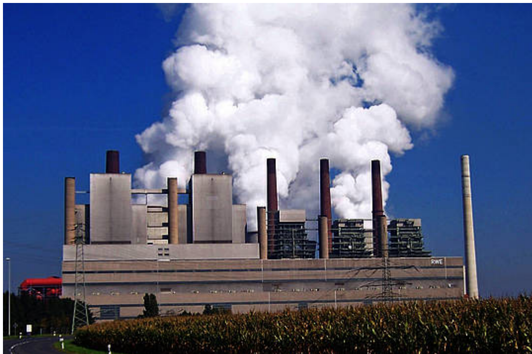
Bild 4. Die oft als Dinosaurier geschmähten großen Dampfkraftwerke – hier das Kraftwerk Neurath – sind für die Aufrechterhaltung der Netzstabilität ganz einfach unersetzlich