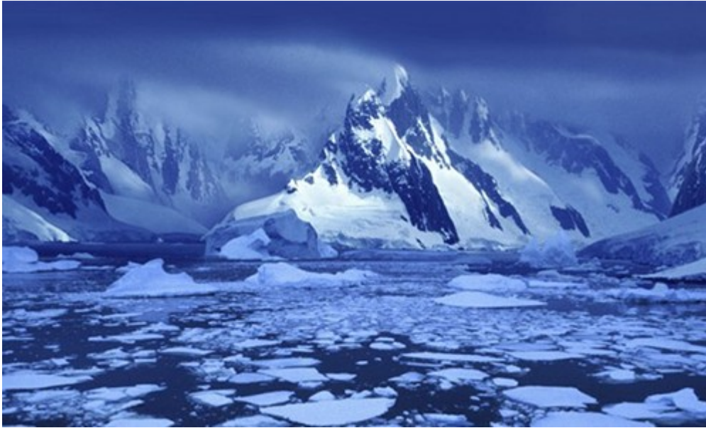
Das könnte Tahiti sein in einer weiteren Schneeball-Phase

Phase wechseln sollte, würde keine Spezies der heutigen Flora und Fauna überleben.