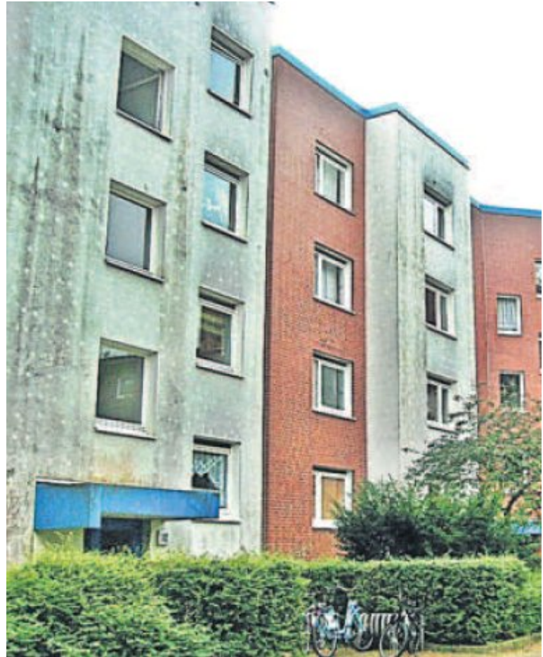
Bild: Unansehnliche gedämmte Häuserfassaden mit Algen- und Schimmelbefall:

Durch die alltägliche Lüftung von Haus und Wohnung gelangen gefährliche Sporenträger in die Raumluft, dort können sie verschiedene Atemwegserkrankungen auslösen