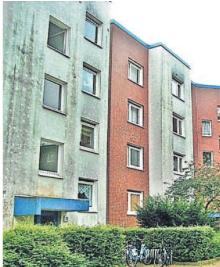
Bild: Unansehnliche gedämmte Häuserfassaden mit Algen- und Schimmelbefall:

Durch die alltägliche Lüftung von Haus und Wohnung gelangen gefährliche Sporenträger in die Raumluft, dort können sie verschiedene Atemwegserkrankungen auslösen