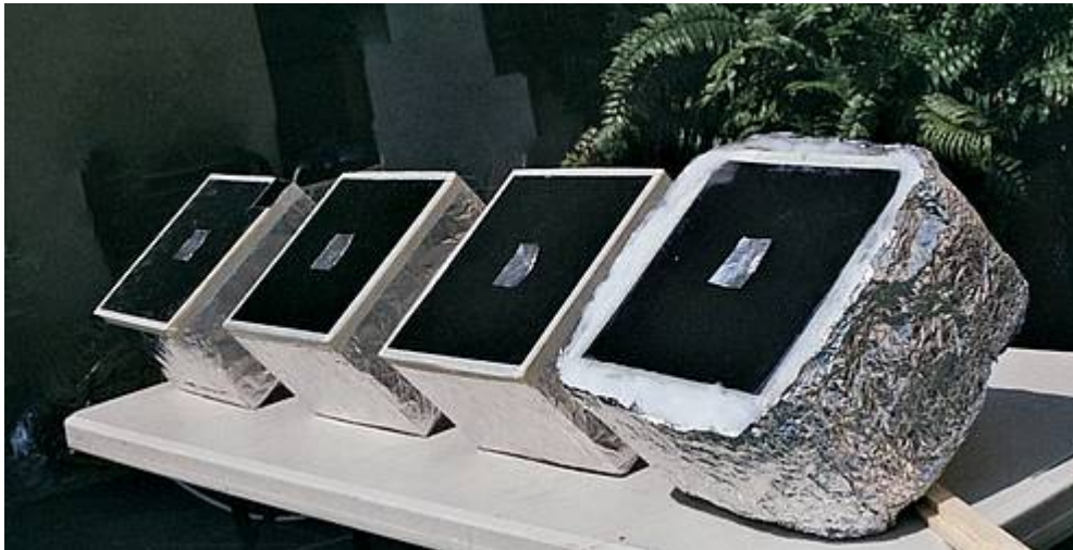
Abbildung 1: Darstellung der Messboxen

* Der Autor ist dankbar für die Principia Scientific International Team für die freundliche Unterstützung mit dem Text, trotzdem sind Fehler in den Text mir allein.