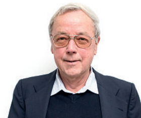
von Klaus-Eckart Puls – Diplom-Meteorologe

Hier genügt es, eine zusammenfassende Wertung des FOCUS 43 anzuführen: „Weiter drohen politische Verwerfungen ... Wer soll die Hände am Thermostaten der Erde haben? Es ist unwahrscheinlich, dass sich die Welt auf ein optimales Klima einigen kann. Was geschieht, wenn es Russland ein wenig wärmer haben will, Indien aber ein paar Grad kühler? Ganz zu schweigen von den zusätzlichen Treibhausgasemissionen durch die massenhaften Flugzeugstarts, die auch an den Erdölreserven der Welt zehren. Andere Forscher lassen an solchen Projektideen kein gutes Haar. Die Pläne, das Erdklima nach eigenem Gutdünken zu gestalten, seien Größenwahnsinnig und vermutlich gar nicht durchführbar. Zudem wisse niemand, wie sich solche Eingriffe auf die Ökosysteme des Planeten auswirken.“