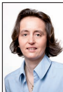
Beatrix von Storch Vorsitzende des Vereins Zivile Koalition e.V.