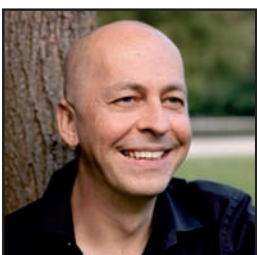
Oliver Janich Bundesvorsitzender der Partei der Vernunft