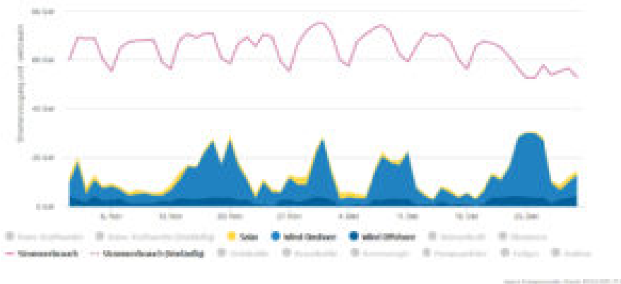
Bild 4 Verlauf der Ökostrom-Einspeisung Deutschland im November – Dezember 2016.

Welcher Abstand zum Bedarf besteht, zeigt nochmals Bild 4. Und dabei sprechen Greenpeace und ein GRÜNER Minister von „Verstopfung“ durch die konventionellen Kraftwerke.